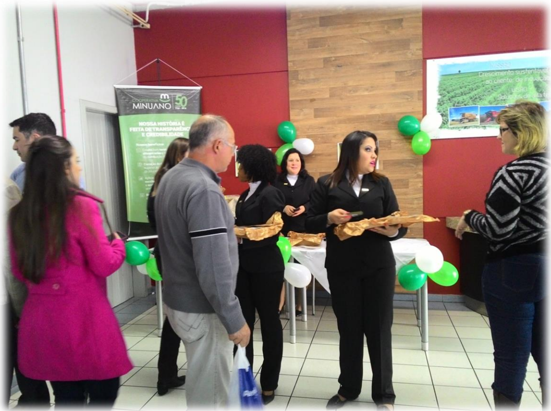
Distribuição dos brindes comemorativos.