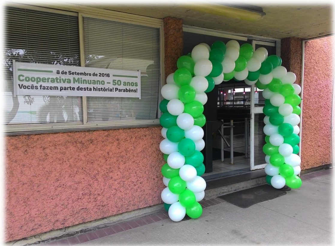
Entrada do refeitório da empresa AGCO em Canoas.