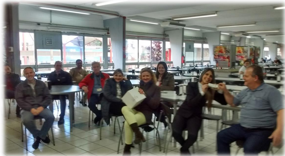
Associados aguardando o sorteio da cesta de brindes.