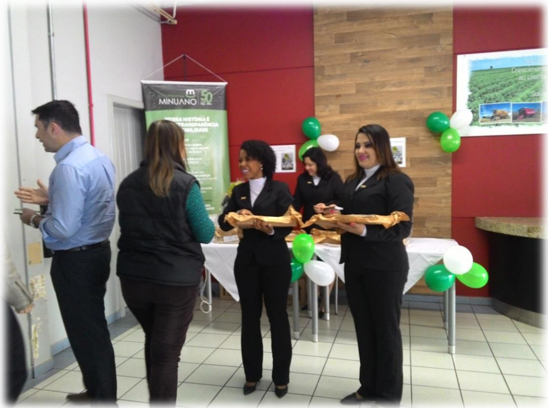
Distribuição dos brindes comemorativos.