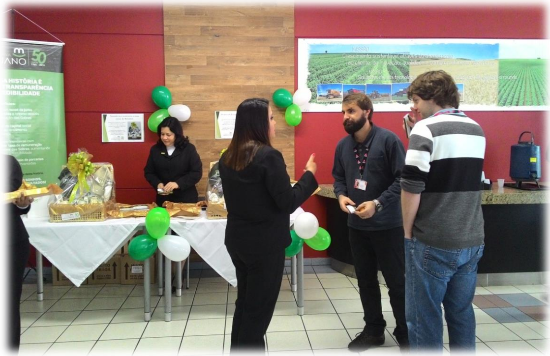
Distribuição dos brindes comemorativos.