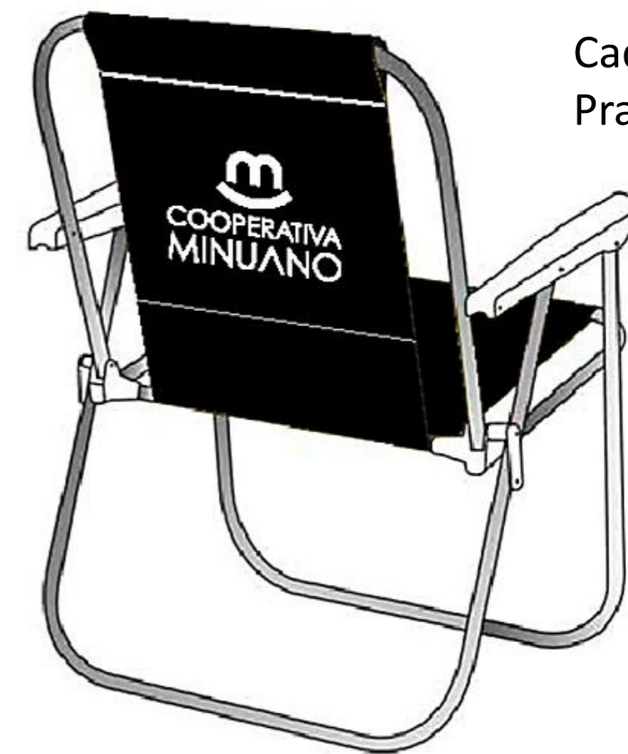
Cadeira de Praia